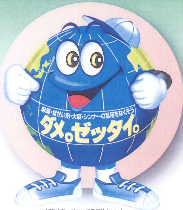
(公財)麻薬・覚せい剤乱用防止センター