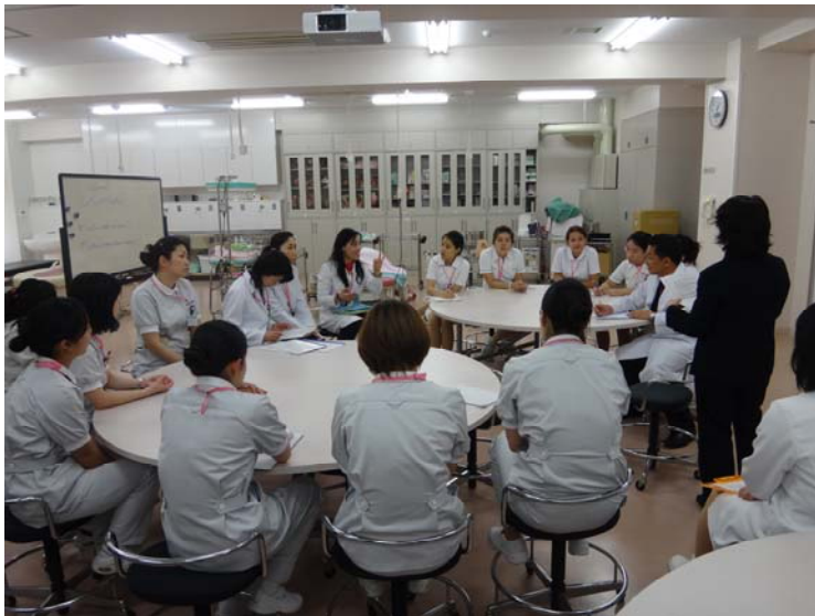
家族・生殖看護学 (4月25日)