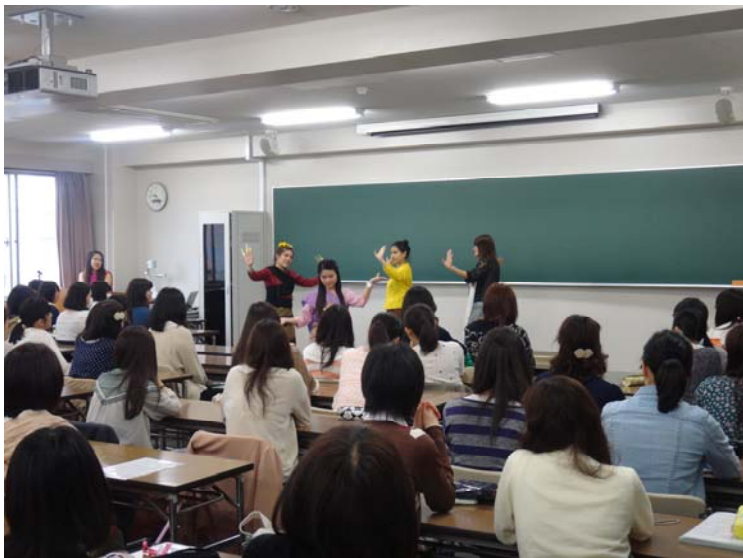
学部1年生との文化交流 (4月27日)