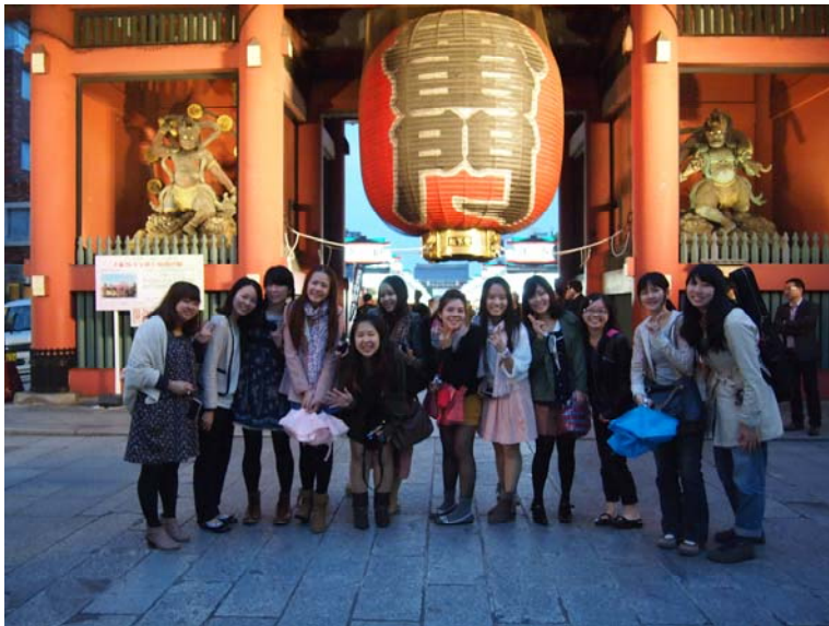
学生ボランティアによる 課外活動