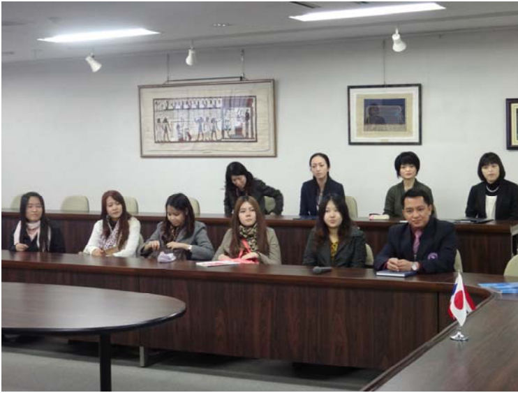
オリエンテーション (4月23日)