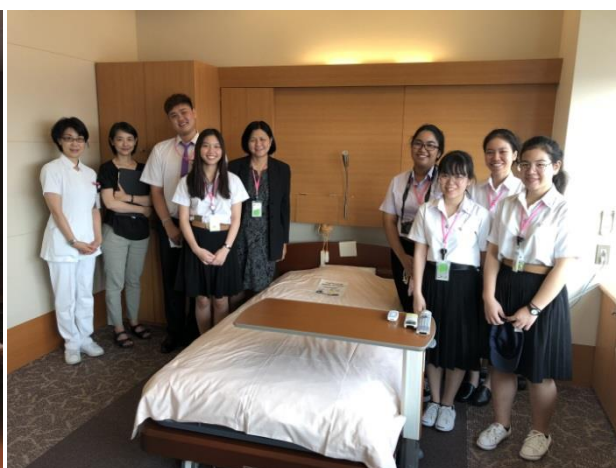
医療センター大森病院訪問