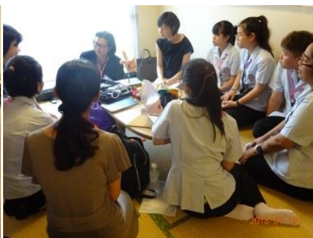
ケアにいかす超音波エコーを紹介