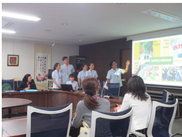
チェンマイ学生によるプレゼンテーション