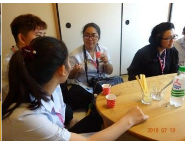
炭酸ジュースにとろみ剤