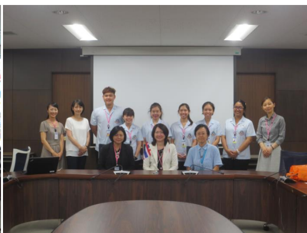
記念撮影（修了式にて）