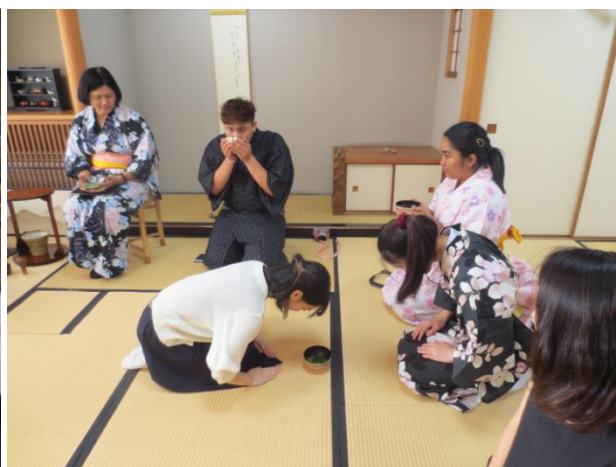
日本文化体験（茶道）